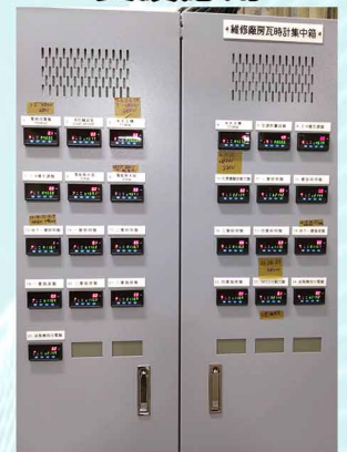
大林電廠電力系統架設